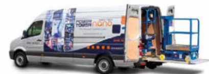
Die Power Towers-Vorführeinheit