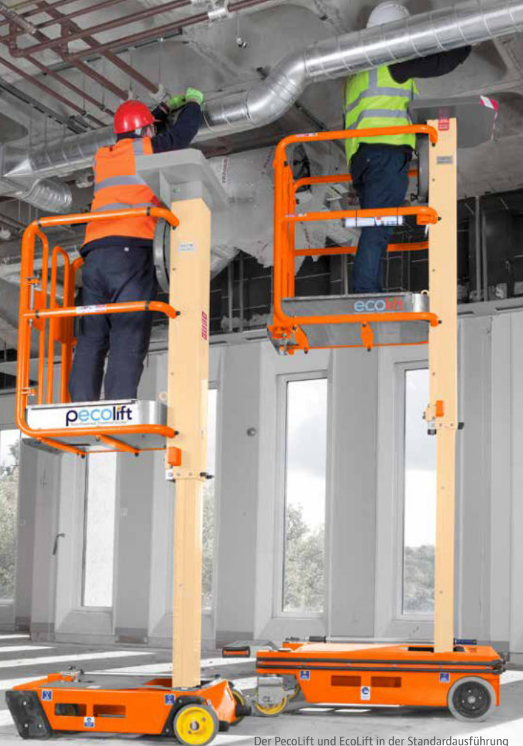
Der PecoLift und EcoLift in der Standardausführung