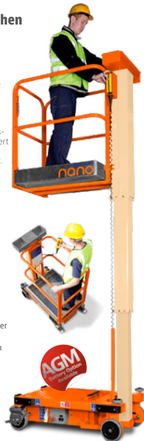
Größte Plattformgröße ihrer Klasse; kleine Aufstandsfläche.

Anwendungen: Sekundäre Wartungsarbeiten Einzelarbeiten Rohrleitungsbau. Gebäudetechnik. Ladenausbau. Ladenumbau.