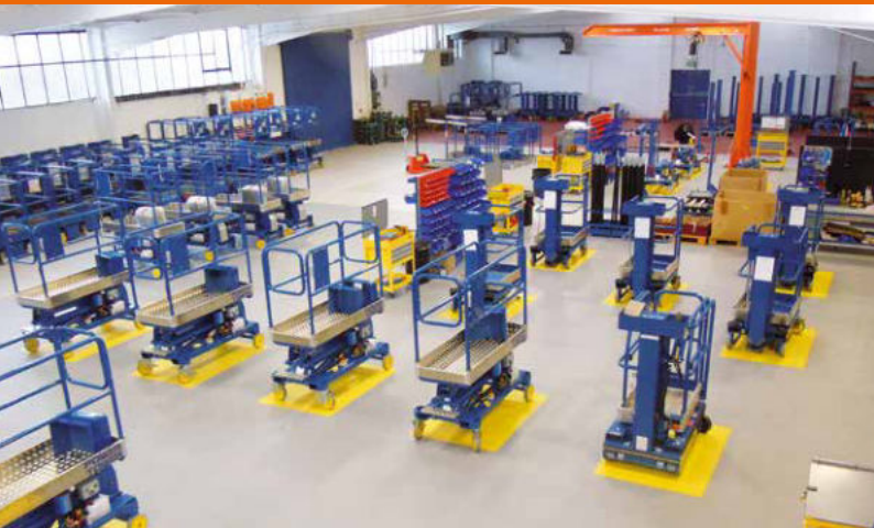
Die Power Towers-Fertigungsstätte

Power Towers wurde im Juni 2015 von JLG übernommen. Als weltweit größtes Unternehmen für Arbeitsbühnen für niedrige Höhen bietet JLG ein unübertroffenes Netzwerk von Händlern und Kundendienstleistungen und kann sich rühmen, sowohl die größte Zugangsmaschine – mit dem 1850SJ und einer Arbeitshöhe von 56 m – als auch die kleinste Zugangsmaschine – mit dem PecoLift und einer Arbeitshöhe von 3,5 m – der Welt zu fertigen. Die Partnerschaft bietet große Chancen und setzt viele Ressourcen frei und verbreitert das Spektrum bei der Konstruktion und Entwicklung unserer marktführenden Arbeitsbühnen für niedrige Höhen.